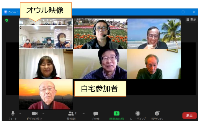
ギャラリービュー