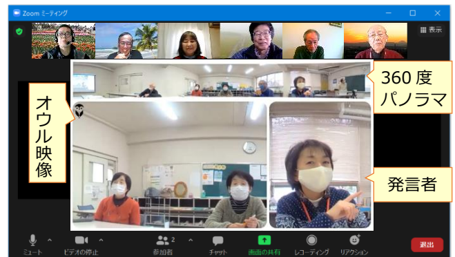
スピーカービュー

上図はZoomの画面です。オウルの映像は360度パノラマ画像で会議室の全景が映り、発言者が大きく表示されます。オウルの映像の画質は良く、会議室でのオウルのマイク音声も自宅参加者のパソコンで良く聞こえます。オウルのスピーカーも自宅からの声の音量が十分にあります。会議室で2~3人が同時に発言すると音声はそのまま聞こえ、発言者の映像は自動的に最大3分割で表示されます。