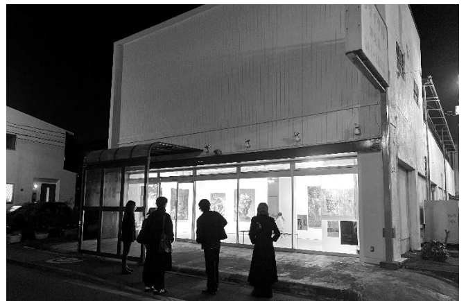
(ザ・ベイシーズ 外観)

特に「作品への照明の当て方」や「アーティストの確定申告・保険の基礎知識」など、実践的なテーマは好評を集めています。