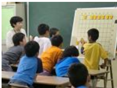
将棋教室ではプロ棋士の谷川治恵氏も教える。子どもたちもとても楽しみにしている

保護者と地域住民の方の距離が近いので、子育てが一段落した世代の地域住民の方に、保護者が子育ての相談をしたり悩みを聞いてもらったりということもあるそうだ。ふだんから放課後子ども教室の場で接して信頼関係ができていからこそそのエピソードである。