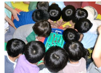
好きなことをして過ごす教室で人気のボードゲーム。頭の下は一体どんな笑顔が?