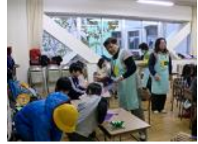
三小ちゃんエプロンをつけたスタッフと子どもたち(折り紙教室にて)

三小放課後子ども教室では、年間約200回の教室を開催。教室の内容はクッキングや折り紙・将棋・生け花・習字、またはいろいろな学年の子どもたちが体を動かして一緒に遊ぶもの、読書と読み聞かせの教室、好きなことをして自由に過ごす教室など多岐にわたり、約24種類にもなる。そのほとんどが近所にお住まいの方を講師として迎えて開催される、地域密着・手作りの教室である。子どもたちは放課後のひとときを学校という安心できる場所で過ごし、他の学年の子どもや近所の大人たちと触れ合う。子どもが安心して過ごせる場所であり、社会性も養われる場である。