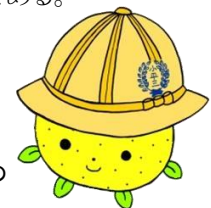
(右)三小のキャラクターの「三小(みこ)ちゃん」

三小放課後子ども教室は、子どもたちの安心できる居場所であり、同時に地域の絆作りの役割も果たしている。