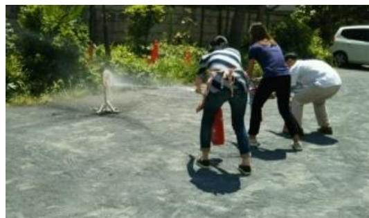
的に向かつて消火器体験

データ 小平市国際交流協会（K I F A : Kodaira International Friendship Association.）市民が中心となつて、地域における国際交流の推進と、外国との交流の促進活動拠点。平成2年設立。学園西町地域センター3階。国際こどもクラブ、多文化理解講座等を開催。