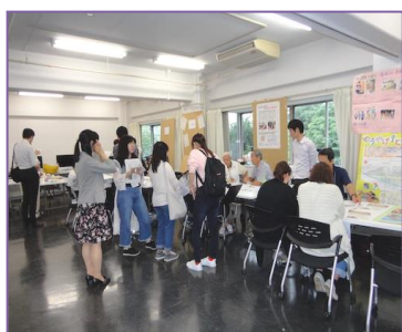
団体のブースで説明を聞く学生たち