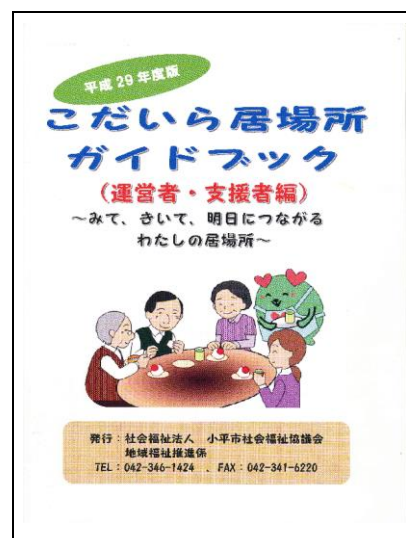
市内 38 カ所の居場所が紹介された、当日配布の冊子

～みて、きいて、明日につながる、わたしの居場所～という副題で、標記の連絡会が、5月25日(木)に福祉会館で行われた(居場所関係者52名、関係機関28名、計80名参加)。3月の第1回目は73名が集まり、地域別グループに分かれて居場所についての情報交換を実施。今回は第2回目ということで、基調講演と今後の居場所づくりについて、すでに居場所を運営している人、これから考えている人、関係機関等を交えて、小平の現状と課題、そして、居場所づくりの意味と今後についての話し合いがなされた。中でも、居場所の発想が広がるワークショップではいろいろなアイデアを織り交ぜながら、面白い居場所がいくつも提案されていた。最後に、コミュニティ ソーシャル ワーカー (CSW) 事業の開始、冊子「こだいら居場所ガイドブック」等の情報提供があった。