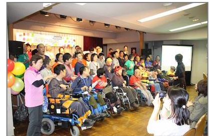
オープニングのこげら合唱団

3月以来開催された運営企画・実行委員会、バリアフリーの仲間達が一緒になって準備してきたこのイベントは、柔らかいおもてなしの心に包まれた、幅広い世代に喜ばれる、小平のまちが誇ってよい年末の風物詩的行事になっていると思います。一流料亭の幕の内弁当、いや京都の心と味のおせちといったところでしょうか。出演者は折角の腕を振るう時間が30分ですが、幅広い世代に喜んでもらえる、飽きがこない色んな味わいのあるパフォーマンスを楽しめる絶妙な時間割・多様化された演目でしょう。あと1年が待ち遠しい半日がかりのイベントでした。 “歌声の湧きいづるよう 冬日和” (報告:江口)