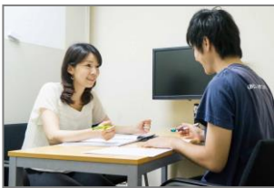
就活に向けて相談

ていて、日々のミーティングで状況を共有しています。そして月 1 回のケース検討会を行い、若者の就労に向けて支え方をスタッフ同士で話し合っているそうです。