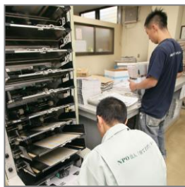
仕事にチャレンジ

ますが、そんな時には対処方法を見せることでお手本にしてもらいます。現在ジョブトレに通っている若者は 30 数名、それを複数のスタッフがチームを組んで一人ひとり見