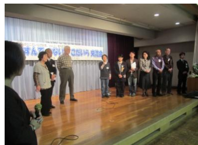
活動等を紹介する取材協力の方々