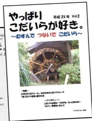
(右)平成25年Vol.2 こだいらふるさと冊子