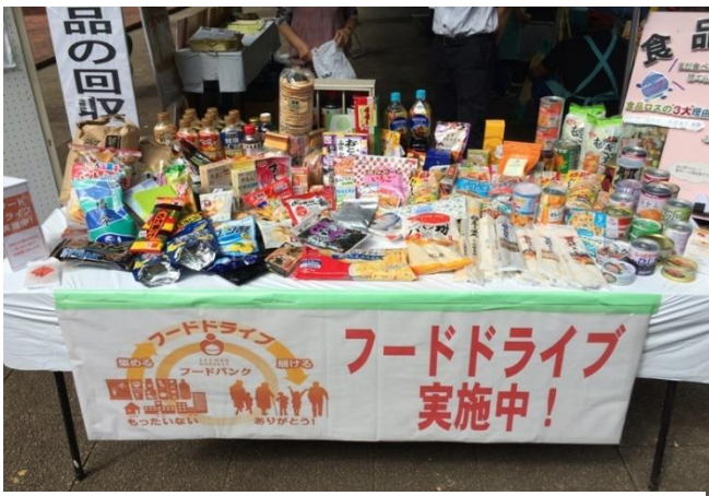
集まった食品の一例

NPO法人セカンドハーベストジャパンに送るまでもなく、市内の子ども食堂、施設等への配布が考えられないかとも思うが、「たべもの」ということで、消費期限、アレルギー問題等々について、責任をもって管理運営していくことがなかなか難しい課題と感じた。