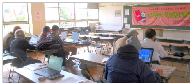
スマホ・パソコンお助け隊の活動(あすぴあ会議室)