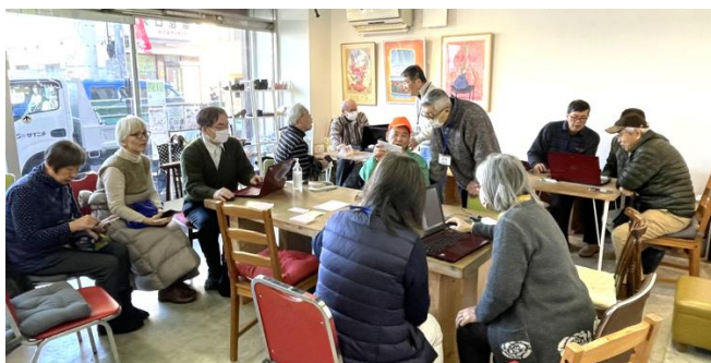
第1回デジタル相談カフェ(1月8日、豊生サロン)