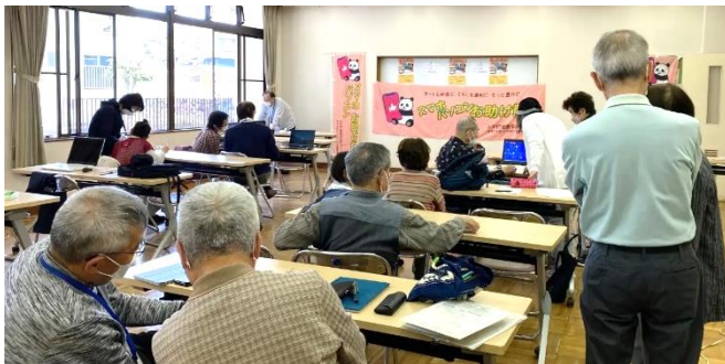
「スマホ・パソコンお助け隊」の活動の様子

市民が自分のスマホやパソコンを会場に持参して、実際に操作しながら、使い方をマンツーマンで相談できる講習会「スマホ・パソコンお助け隊」を2023年度の1年間に毎週計49回実施した。会場は小平市内の公民館や地域センターなど計32か所を巡った。また、オンラインのZoomを利用して、自宅から参加できる機会を4回設けた。講習会の案内は市報に掲載し、チラシを毎月1,000部印刷して公民館、地域センター、自治会などへ配布した。講習会の参加者は延べ383人で団体のスタッフが参加者の相談に対応した。