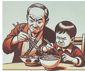
作成された「不味そうに食べるイラスト」

生成 AI の体験学習会では、自分のパソコンで AI に梅干しの写真を認識させ、そこからメニューを考えさせる演習、AI にイラストを作成させる演習などに取り組みます。