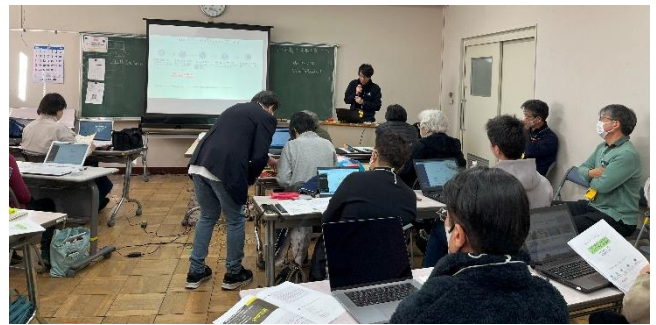
参加者の学習風景

年齢層は8歳から80歳と幅広く、家族連れの参加者も。参加者のレベルもバラバラですが、デジタル部会スタッフが一人ひとりの質問に丁寧に答えるなど、手厚いサポートでカバーをしていきます。