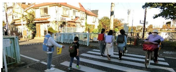
西東京市の下校時の学童交通見守りの風景

市教育委員会では警備会社を使って学童の通学路における防犯も含めた幅広い安全対策を取っている。また交通安全協力者として定期的にボランティアを募集し、各学校に配置している。ちなみに西東京市の場合、全小学校18校68か所を対象に、シルバー人材センターに委託して登下校時(朝夕延べ4時間)の学童の交通安全見守りを行っている(写真)。