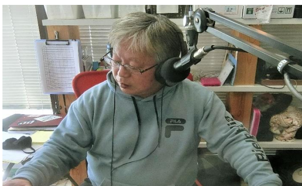
本番放送中のスタジオの様子