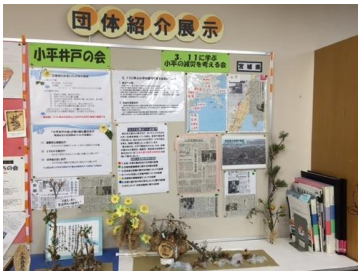
「小平井戸の会」と「3.11に学ぶ小平の減災を考える会」が合同で展示しています。

【申込方法】4月30日までに、住所、氏名（ふりがな）、年代、電話番号、応募動機を、FAXまたはメールまたは送付のいずれかの方法で問合せ先へお送りください。申込多数の場合は選考により決定します。応募申込書はあすぴあ窓口にあります。ホームページからダウンロードもできます。