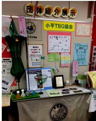
他団体の展示は参考になります (写真は「小平ターゲットバードゴルフ協会」)

交流スペースでは、市民活動団体の活動を紹介する展示を行っています(1団体約1ヶ月間)。1月は13日から「NPO法人子ども未来研究所みりーあーと」の予定。展示をご希望の団体は窓口までお申し出ください。