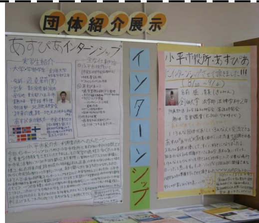
「インターンシップ生の活動報告」を展示中。次は「プアナ・ティアレ（フラダンスの会）」の予定。

9月5日（金）にNPOフェスタ参加団体の全体会が開かれました。屋内広場の頭上を飾る各団体のPR看板、駐車券・お弁当・団体インタビューの申込み方法やその他の提出書類の説明がありました。参加団体から次々と質問が出る活気のある全体会でした。今年は、大きなインタビューボードの前で野球・サッカー監督の気分でインタビューが受けられることになりました。楽しいことが増えていきます。